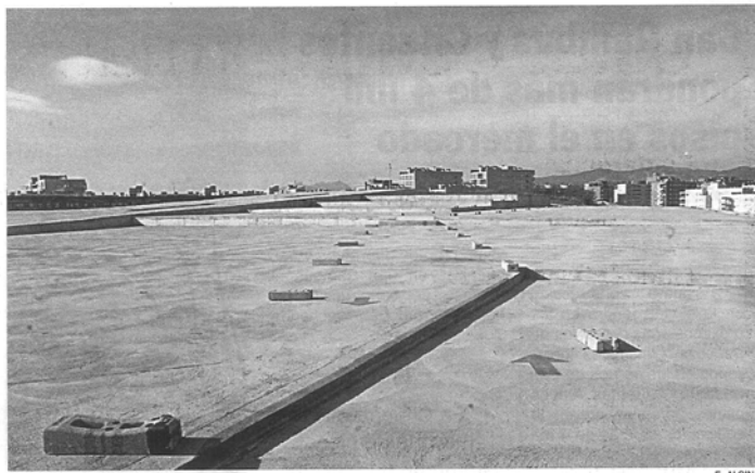
El Parc de les Aigües s'urbanitzarà sobre aquesta coberta del dipòsit

serà, a més, un mirador de la ciutat, una circumstància que contribuirà a que els seus nivells d'utilització siguin molt elevats. El Parc de les Aigües