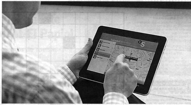
Los productos tecnológicos son considerados los más innovadores

En el caso de la telefonía móvil, que está considerado el sector más innovador (8,1 sobre 10), «sólo el 49% de los consumidores identificó productos como el iPhone, las pantallas táctiles y el 3G, pero la mayoría no fue capaz de dar ninguna respuesta».